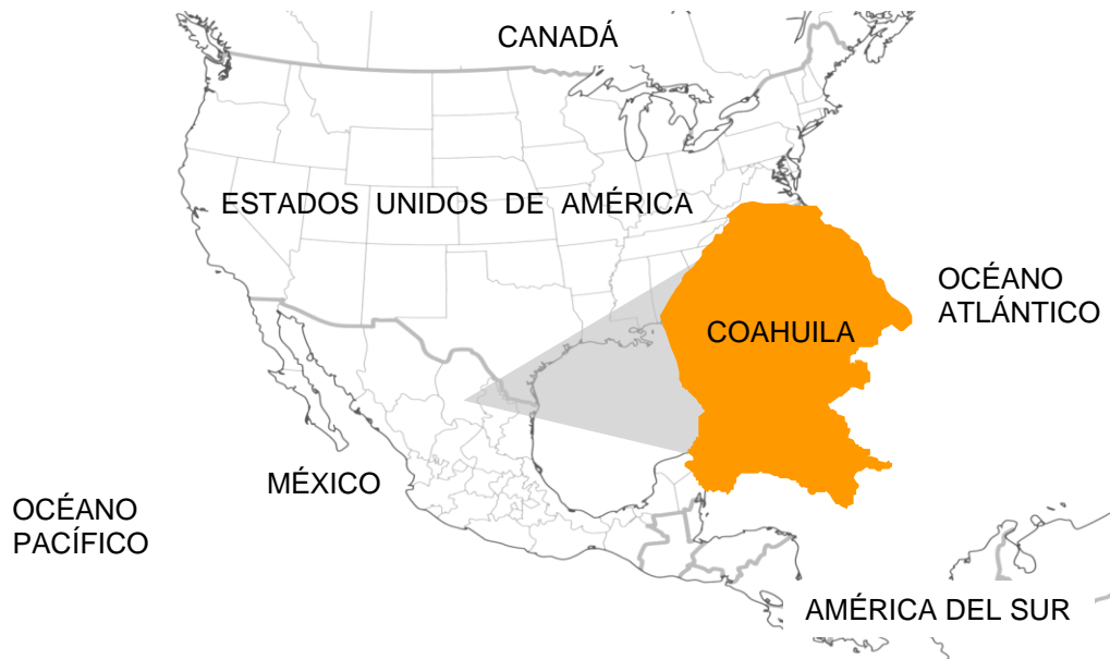
Ubicación de Coahuila de Zaragoza en Norteamérica.

Coahuila de Zaragoza es el tercer estado más grande del país, se encuentra localizado en el Noreste de México y comparte una frontera de 512 kilómetros con el estado norteamericano de Texas. En México, colinda con los estados de Chihuahua, Durango, Zacatecas, San Luis Potosí y Nuevo León.