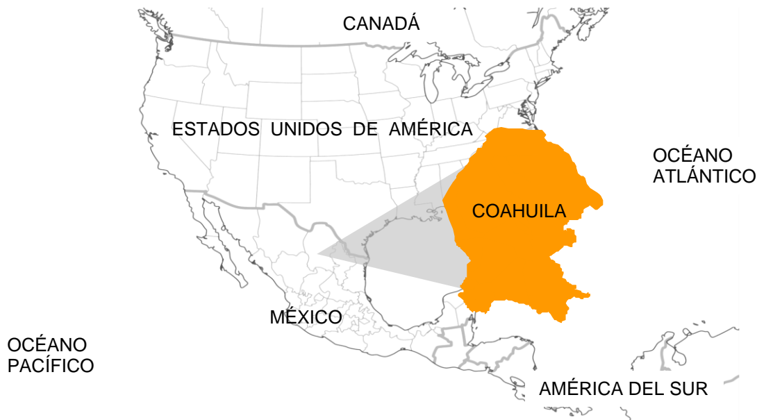
Mapa 1. Ubicación de Coahuila de Zaragoza en Norteamérica.

Coahuila de Zaragoza es el tercer estado más grande del país, se encuentra localizado en el Noreste de México y comparte una frontera de 512 kilómetros con el estado norteamericano de Texas. En México, colinda con los estados de Chihuahua, Durango, Zacatecas, San Luis Potosí y Nuevo León.