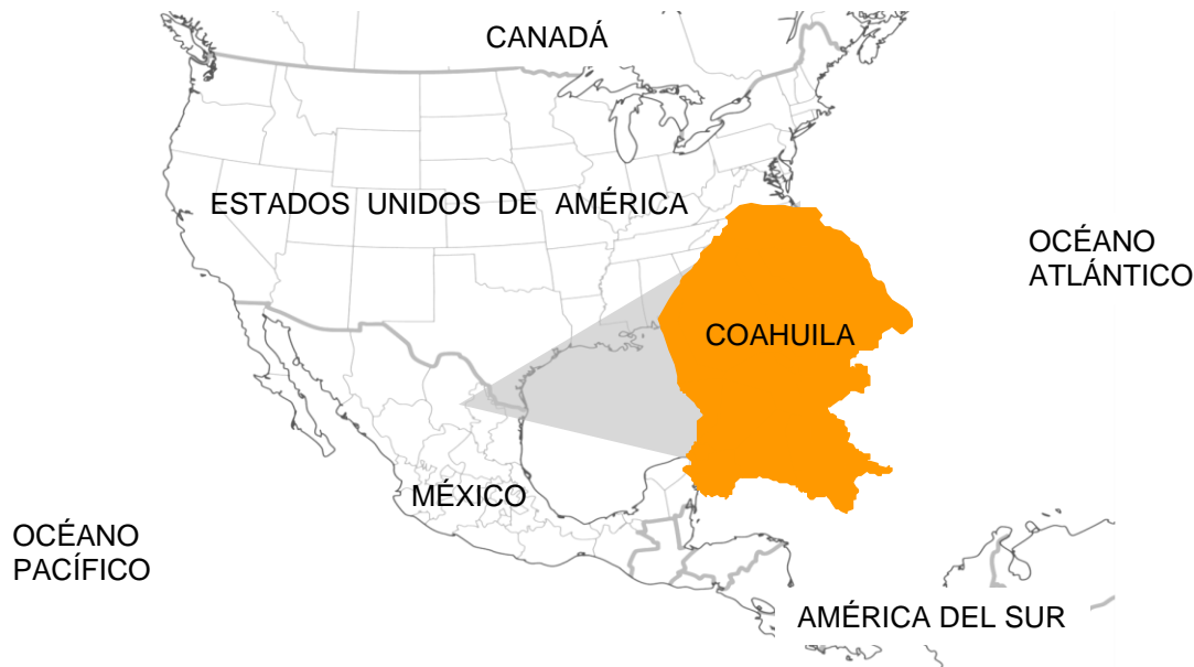
Ubicación de Coahuila de Zaragoza en Norteamérica.

Coahuila de Zaragoza es el tercer estado más grande del país, se encuentra localizado en el Noreste de México y comparte una frontera de 512 kilómetros con el estado norteamericano de Texas. En México, colinda con los estados de Chihuahua, Durango, Zacatecas, San Luis Potosí y Nuevo León.