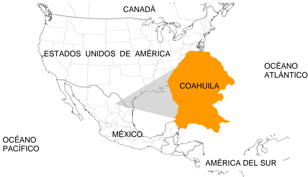
Ubicación de Coahuila de Zaragoza en Norteamérica.

Coahuila de Zaragoza es el tercer estado más grande del país, se encuentra localizado en el Noreste de México y comparte una frontera de 512 kilómetros con el estado norteamericano de Texas. En México, colinda con los estados de Chihuahua, Durango, Zacatecas, San Luis Potosí y Nuevo León.